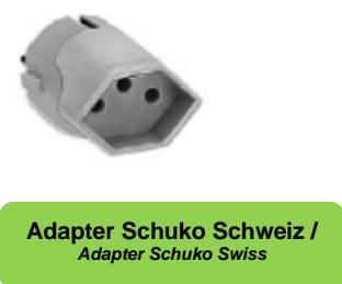
Adapter Schuko Schweiz / Adapter Schuko Swiss