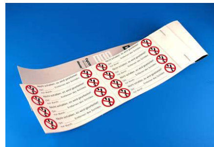
ABBILDUNG Brückenschild NICHT SCHALTEN