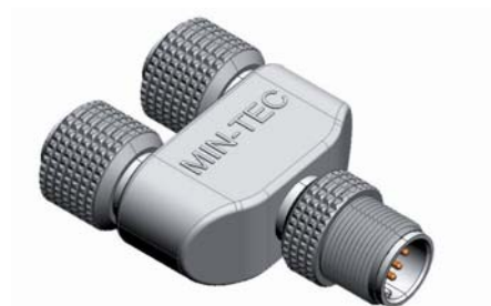
ABBILDUNG Stecker M12- M8

Alle Produktinformationen finden Sie unter www.gogatec.com .