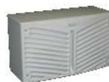
90-CU30 Querformat für Bediengehäuse und kleine Schränke