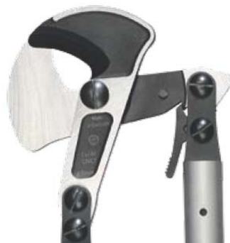
Optimaler Krafteinsatz durch Knickmechanik