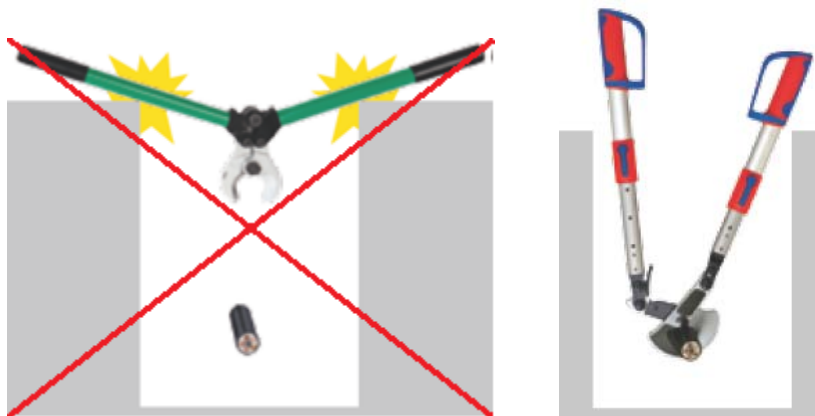
Besonders geeignet unter beengten Arbeitsbedingungen