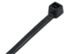
Widerstandsfähigkeit gegen UV-Strahlung in Installationsjahren/ resistance to UV-radiation in working time (years):